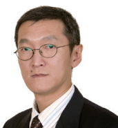
康晓光 非营利管理方向 教授

简介：中国人民大学公共管理学院教授、博士生导师；中国人民大学非营利组织研究所所长；清华大学公共管理学院兼职教授；友成企业家扶贫基金会、中国青少年发展基金会等多家知名基金会理事。曾获“中国科学院科技进步一等奖”；代表作包括《仁政》、《行政吸纳社会》等。研究领域：非营利组织管理、国家与社会关系、政治发展与政治稳定和政治文化。