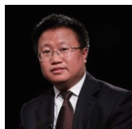
毛寿龙 公共政策分析课程 教授

简介：中国人民大学公共管理学院教授、副院长、博士生导师；中国人民大学政府管理与改革研究中心主任，国务院学位委员会第六届学科评议组公共管理组成员、中国行政管理教学研究会副会长等。研究领域：政府改革、公共治理、风险管理。