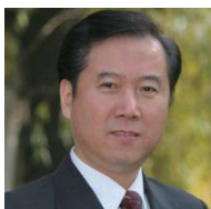
董克用 社会建设理论与实践课程 教授

简介：中国人民大学公共管理学院教授、博士生导师；中国人民大学非营利组织研究所所长；清华大学公共管理学院兼职教授；友成企业家扶贫基金会、中国青少年发展基金会等多家知名基金会理事。曾获“中国科学院科技进步一等奖”；代表作包括《仁政》、《行政吸纳社会》等。研究领域：非营利组织管理、国家与社会关系、政治发展与政治稳定和政治文化。