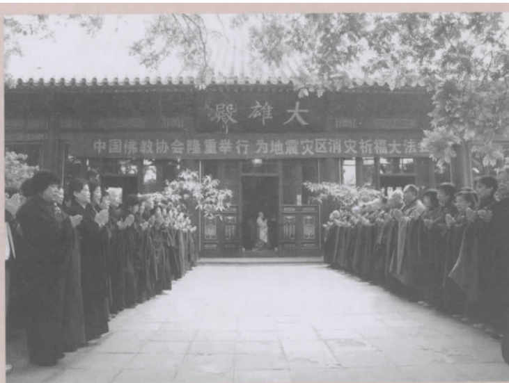
2008年5月14日,中国佛教协会在广济寺隆重举行汶川地震消灾祈福法会。

如上所述,佛教有两项相互联系的本质规定:觉醒了悟和去恶从善。也就是说,在思想认识上,要求开发真智,体得真理。在道德修持上,要求行善除恶,自净其意。觉悟缘起性空的法则,懂得人与人、人与物互为缘起,以及缘起本性皆空、不能执著的道理,就要求关心、同情、帮助他人,与人为善,与人慈善。修持善行的道德实践,与清净心意密切相联,是在慈悲心的基础上的善行。佛教的觉醒了悟和去恶从善的本质规定,确定了慈善是佛教的内在属性,是佛教徒的内在价值理念、价值取向。佛教要求每一个信徒把奉行慈善作为修持的重要方式和生活的重要内